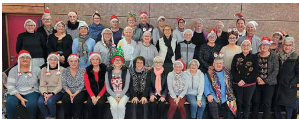
Le groupe Danse Line