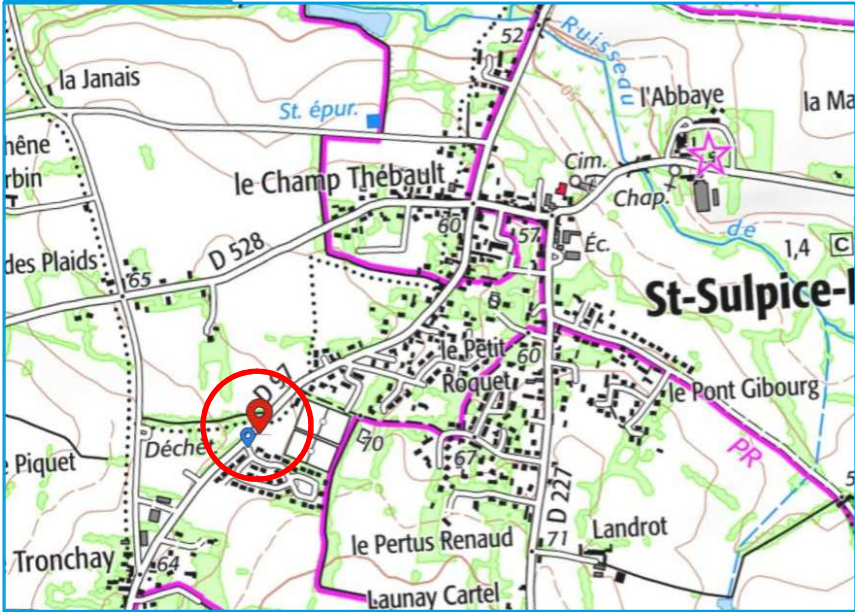
Document sans échelle