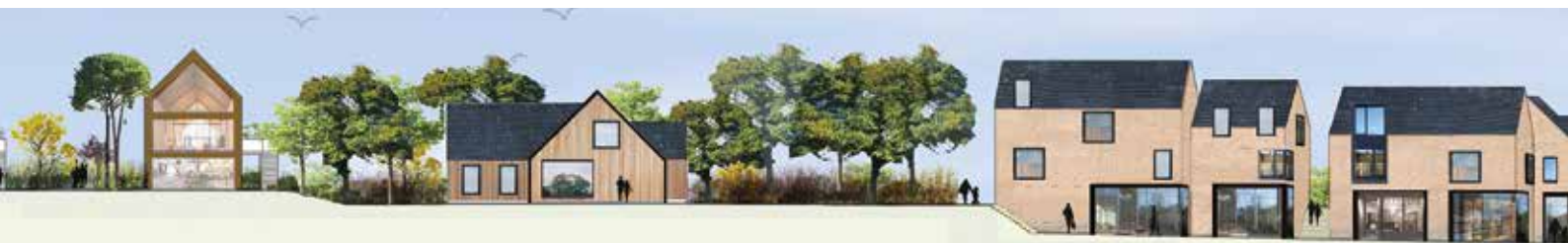
Vue d'ambiance du centre-bourg selon le projet La fabrique du village métropolitain (image illustrative et non contractuelle).

D'autres acteurs (institutionnels, réseau local et régional autour du partage d'expériences sur le développement durable et l'écoconstruction, associations locales) seront impliqués tout au long du projet : Rennes Métropole, L'IAUR (Institut d'aménagement et d'urbanisme de Rennes), La SEM Energ'IV, Bruded, Acroterre et le collectif des terreux armoricains.