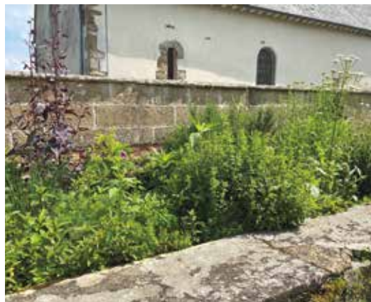
Le Jardin des simples.