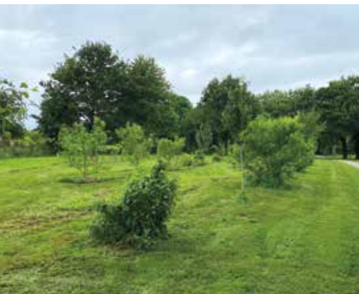
Le Vergers partagé.

Ces lieux sont accessibles à tous. Il est possible d'entretenir ces différents endroits pour ceux qui le souhaitent. Merci de ne récolter aromatiques et fruits qu'en quantité modérée pour partager. Ne pas cueillir les fruits verts.