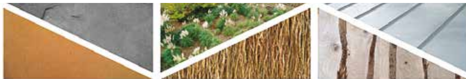
Matériaux : Bauge - Enduit terre - chaux - Ardoise naturelle Surfaces enherbées - Isolation Paille - Bardage dosses - Zinc