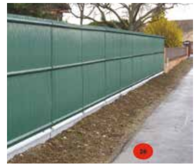
Clôture avec soutènement.