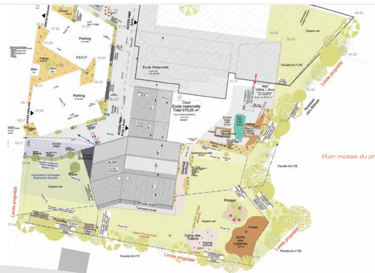
Plan masse du projet.

Les travaux découpés en deux tranches débiteront au premier trimestre 2022. Ils commenceront par l'extension de l'école et le nouvel ALSH. Ils se poursuivront par le centre culturel et l'aménagement des abords, pour une livraison fin 2023. La sécurité du chantier sera une priorité par rapport aux usagers.