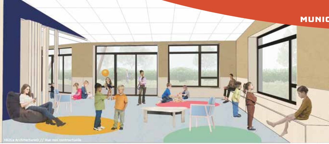
Vue de la salle.