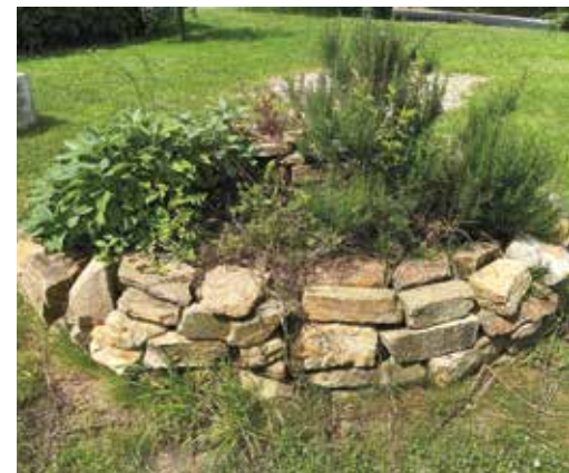
La Spirale aromatique.