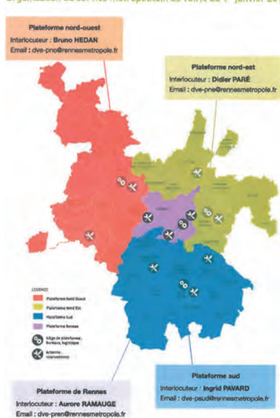
Organisation du service métropolitain de voirie au 1 er janvier 2017

Vous pouvez bien sûr continuer à vous adresser en mairie qui saisira la demande sur le guichet numérique.